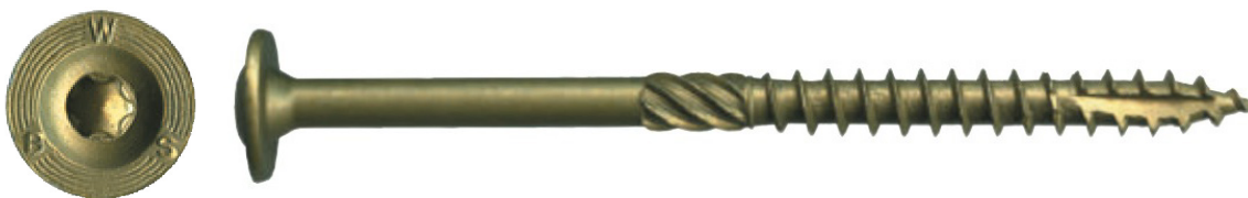
Figure 1. Tire-fond de construction Big Timber CTX